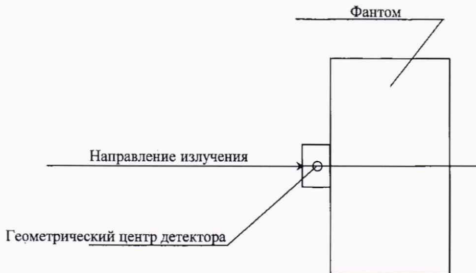
Рисунок 1 – Способ установки дозиметра с фантомом на поверочную дозиметрическую установку.

3) определить среднее значение МЭД внешнего фона гамма-излучения (далее по тексту – гамма-фона) в отсутствии источника излучений, для этого через время не менее 600 с после размещения дозиметра на дозиметрической установке снять с интервалом не менее 150 с пять результатов измерения МЭД гамма-фона и рассчитать среднее значение МЭД гамма-фона \bar{\dot{H}}_{\phi} , по формуле (1). На аналоговой шкале должен индицироваться один сегмент.