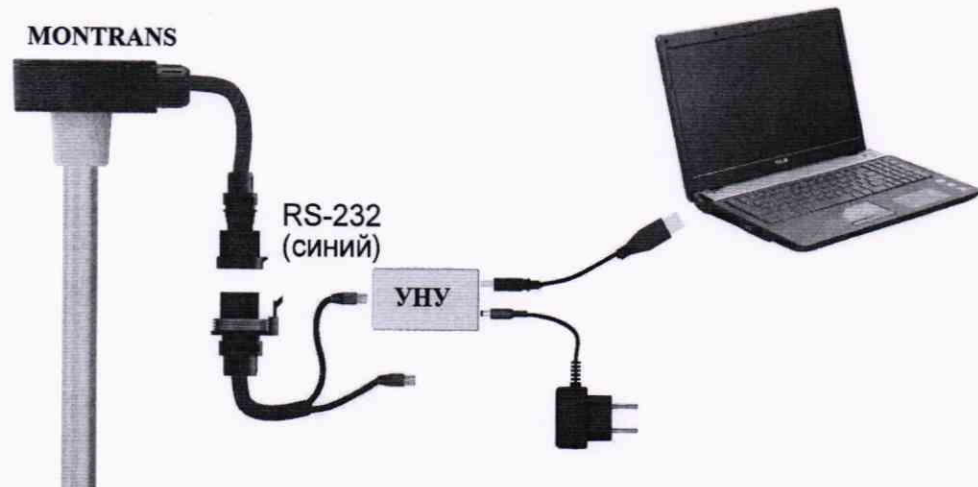
Рисунок А.1 – Схема подключения датчиков уровня топлива MONTRANS к ПК по интерфейсу RS-232