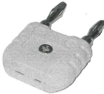
Рисунок 2 – Адаптер TC-to-banana