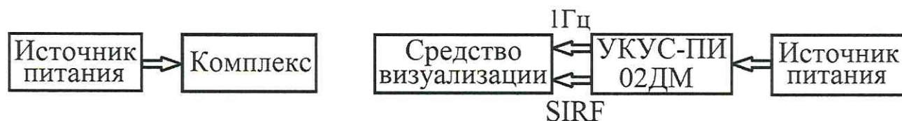
Рисунок 1 – Схема проведения измерений

10.1.2 Обеспечить максимальную радиовидимость сигналов навигационных космических аппаратов ГЛОНАСС/GPS в небесной полусфере. В соответствии с эксплуатационной документацией на комплекс и УКУС-ПИ 02ДМ подготовить их к работе.