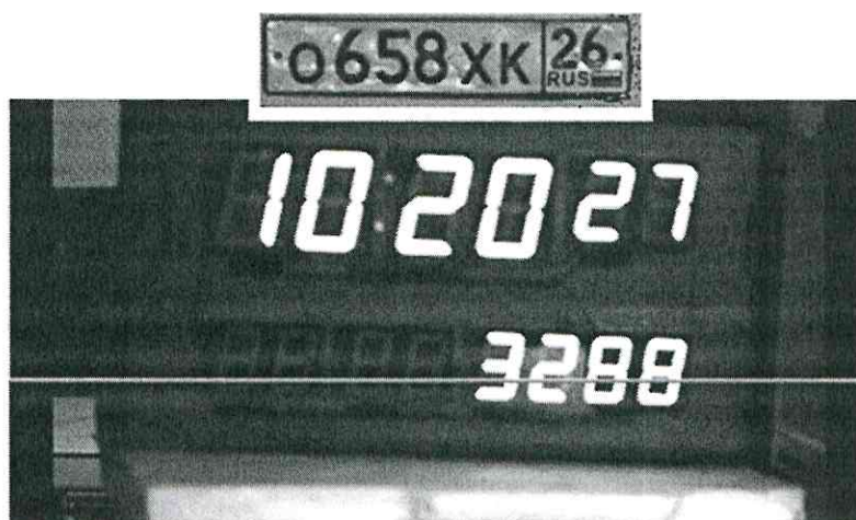
Рисунок 2 — Изображение, полученное комплексом

10.1.4 С помощью ПО комплекса сделать не менее 5 фотографий средства визуализации в течение часа. Записать командой «PrintScreen» фото изображений, полученных комплексом в соответствии с рисунком 2.