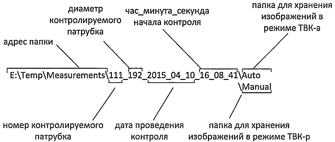
Рисунок 4 – Структура адресов папок, содержащих результаты контроля

Сбор данных в режиме «ТВК-а» осуществляется автоматически, а сохранение изображений контролируемой поверхности происходит на компьютере в папке, название которой содержит номер и диаметр патрубка, дату и время начала контроля. Структура адресов папок, содержащих результаты контроля, приведена на рисунке 4.