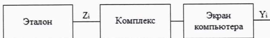
Рисунок 1 - Схема подключений при определении погрешностей ИК

где Z_i – установленное значение частоты, Гц.