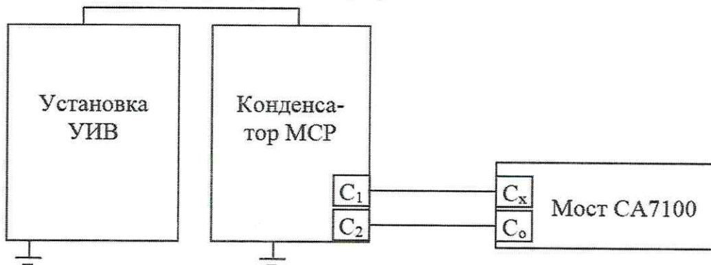
Рисунок 2 - Схема измерений электрической емкости

8.3.2 Включите приборы и дайте им прогреться.