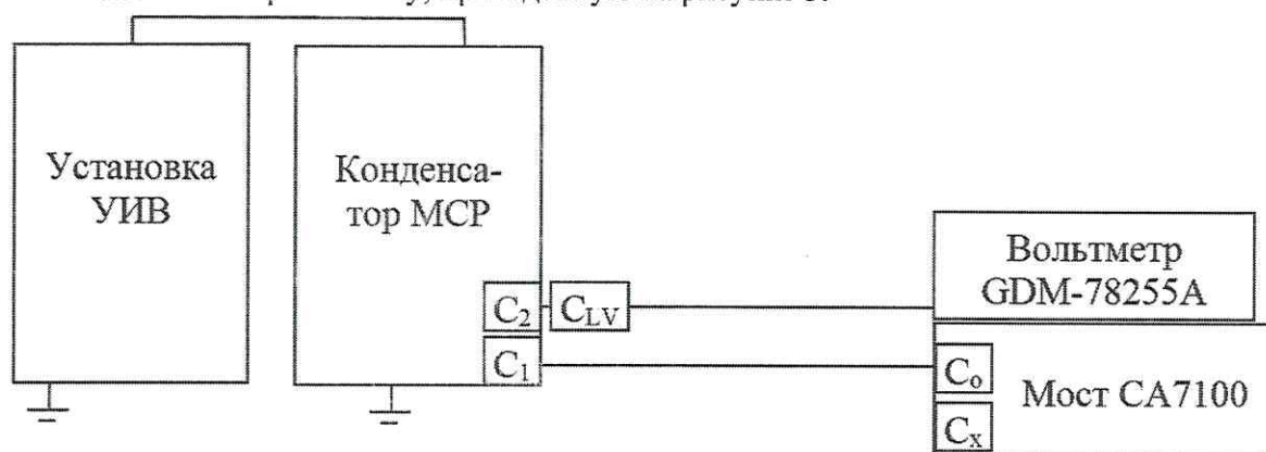
Рисунок 5 - Схема проверки линейности при измерении коэффициента масштабного преобразования напряжения переменного тока

8.5.2.2 Соберите схему, приведенную на рисунке 5.