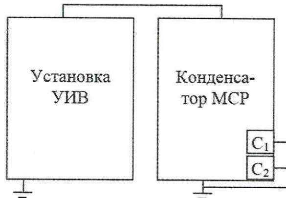
Рисунок 1 - Схема проверки электрической прочности

8.2.2 Сигнальные выводы конденсатора должны быть закорочены на корпус, соединённый с шиной заземления.