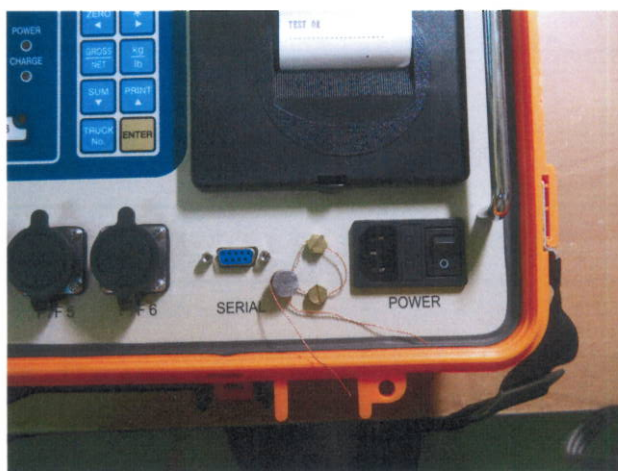
Рисунок 2 – Расположение защитной пломбы

Уровень защиты ПО от непреднамеренных и преднамеренных воздействий в соответствии с МИ 3286-2010 – «С». Защита от несанкционированного доступа к программному обеспечению обеспечивается установкой защитной пломбы на лицевой стороне весоизмерительного индикатора. Расположение защитной пломбы представлено на рисунке 2.