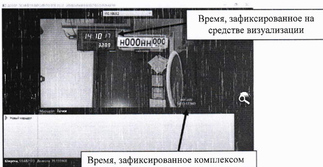
Рисунок 2 – Индицируемое эталонное время и время, наложенное на изображение комплексом

8.4.4 С помощью интерфейсной программы комплекса сделать не менее 10 фотографий средства визуализации, записать командой «PrintScreen» фото изображений: индицируемое время и время, наложенное на изображение комплексом в соответствии с рисунком 2.