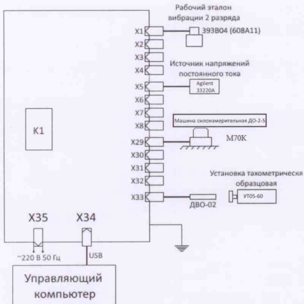
Рисунок А.2. Схема соединений