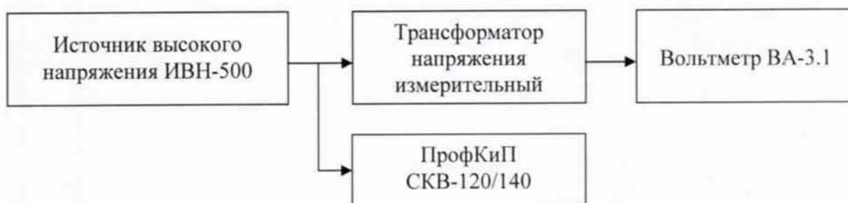
Рисунок 1 – Структурная схема подключения приборов для определения относительной погрешности измерений среднеквадратических значений напряжения переменного тока синусоидальной формы частотой 50 Гц.