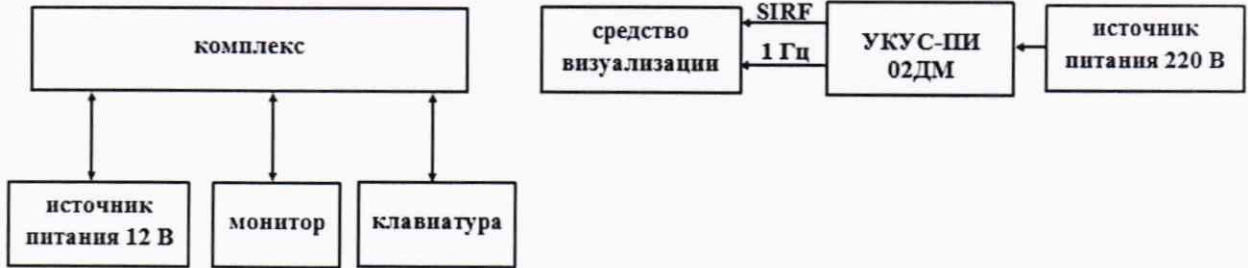
Рисунок 1 - Схема проведения измерений при определении погрешности синхронизации шкалы времени

10.1.1 Собрать схему в соответствии с рисунком 1. Средство визуализации должно иметь разрешающую способность индикации оцифровки метки времени не менее 0,1 с.