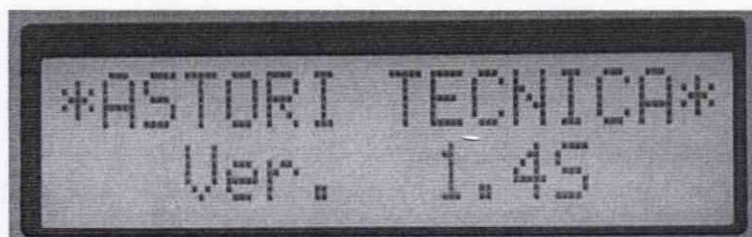
Рисунок 1 - Окно с названием и номером версии ПО

6.3.1.1. Вывод на дисплей окна, в котором указана версия программного обеспечения, осуществляется автоматически после включения питания криоскопа. Окно с номером версии ПО приведено на рисунке 1.