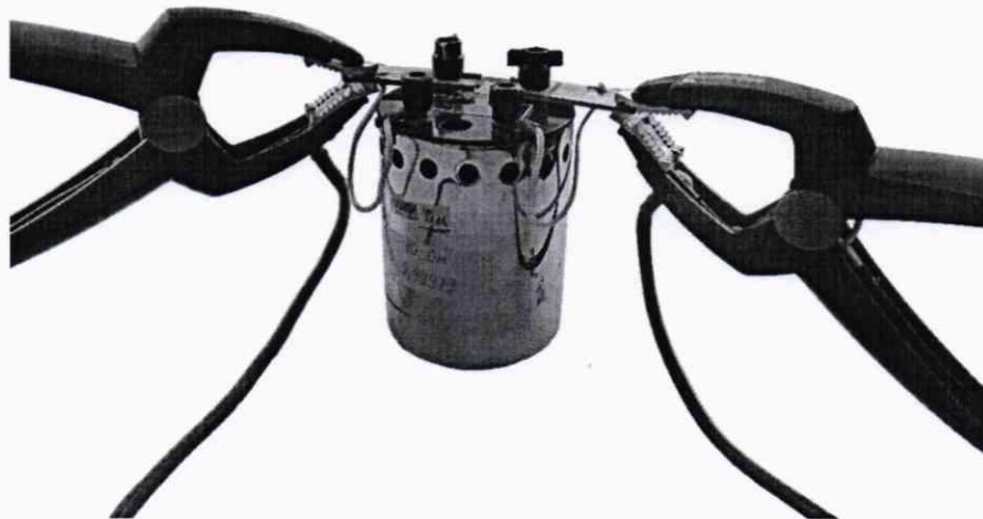
Рисунок А.2 – Подключение зажима измерительного кабеля к катушке