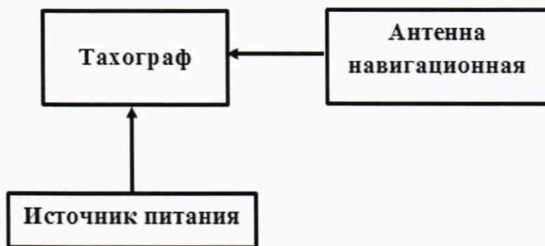
Рисунок 1 – Схема проведения измерений при опробовании

8.2.2.2 Включить тахограф, визуально убедиться в отсутствии ошибок по результатам прохождения внутренних тестов и в индикации текущего времени и даты на дисплее тахографа.