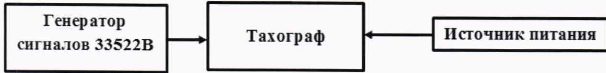
Рисунок 3 – Схема проведения измерений при определении абсолютной инструментальной погрешности измерений скорости по датчику движения

8.5.2 В соответствии с РЭ генератора сигналов 33522В настроить выдачу последовательности прямоугольных импульсов (параметры приведены в п. 8.3.2) частотой f , вычисляемой по формуле (6):