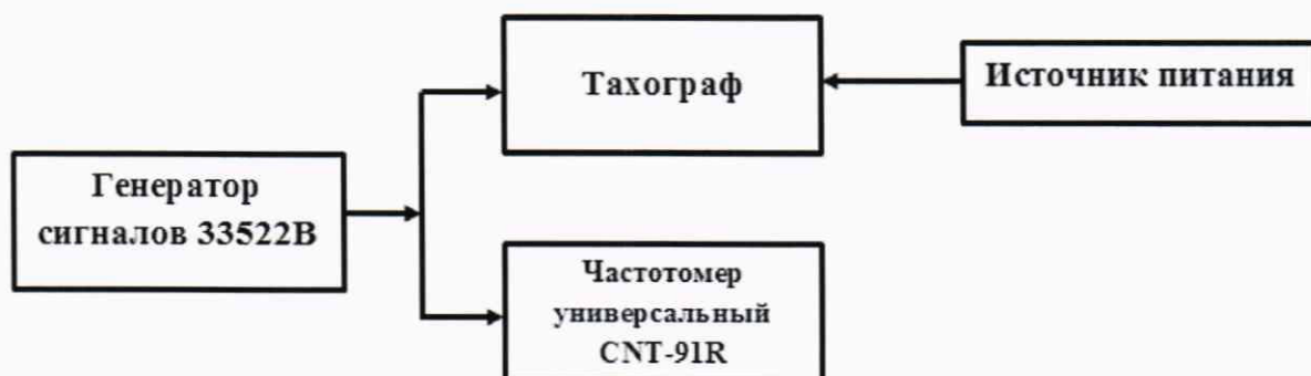
Рисунок 2 – Схема проведения измерений при определении абсолютной погрешности измерений интервала времени и абсолютной инструментальной погрешности измерений пройденного пути

8.3.1 Собрать схему в соответствии с рисунком 2.