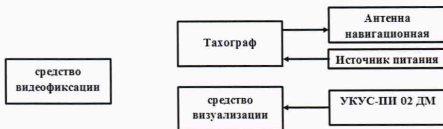
Рисунок 4 - Схема проведения измерений при определении абсолютной погрешности синхронизации шкалы времени внутреннего опорного генератора тахографа со шкалой времени блока СКЗИ

8.10.2 Обеспечить радиовидимость сигналов навигационных космических аппаратов ГЛОНАСС и GPS в верхней полусфере. В соответствии с эксплуатационной документацией на тахограф и УКУС-ПИ 02ДМ подготовить их к работе. Настроить УКУС-ПИ 02ДМ на выдачу шкалы времени, синхронизированной с национальной шкалой координированного времени UTC(SU).