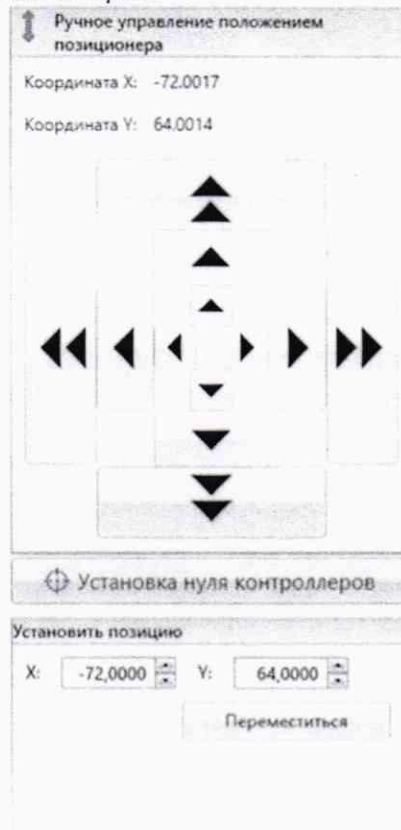
Рисунок 2 – Меню программы для ручного управления движением сканера

Перемещая антенну-зонд с установленным оптическим отражателем вдоль осей Ox и Oy (вертикальная плоскость сканирования) в пределах рабочей зоны сканера с шагом \lambda_{min}/2 (где \lambda_{min} - минимальная длина волны, соответствующая верхней границе диапазона рабочих частот комплекса, до срабатывания механического ограничителя), фиксировать показания системы Leica Absolute Tracker AT401.