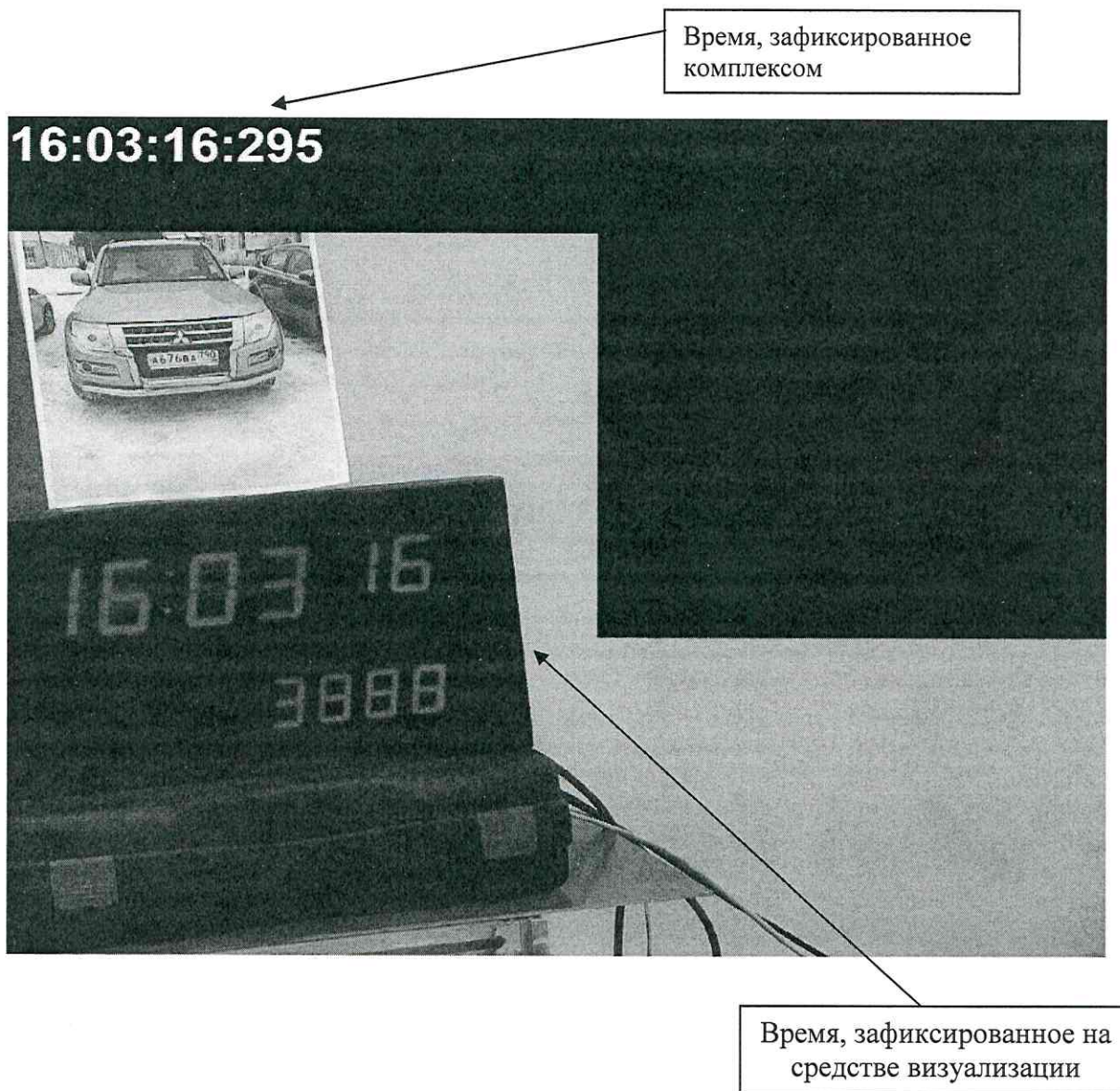
Рисунок 2 – Фотокадр, формируемый комплексом

8.4.4 В течении 1 часа сделать не менее 10 фотографий средства визуализации (Индикатор времени «ИВ-1») каждой из видеокамер, входящих в состав комплекса (рисунок 2).