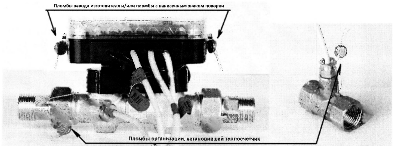
Рисунок 2 – Схема пломбировки теплосчетчика