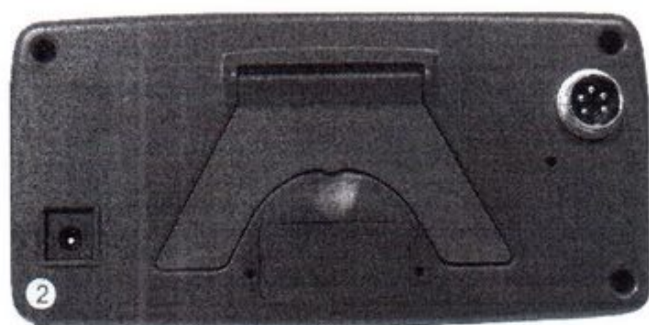
Место пломбировки от несанкционированного доступа

Схема пломбировки электронных блоков приведена на рисунке 1.