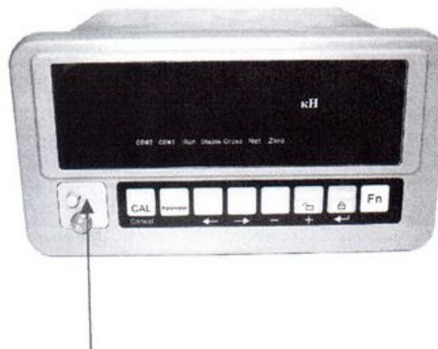
Место для нанесения оттиска поверительного клейма