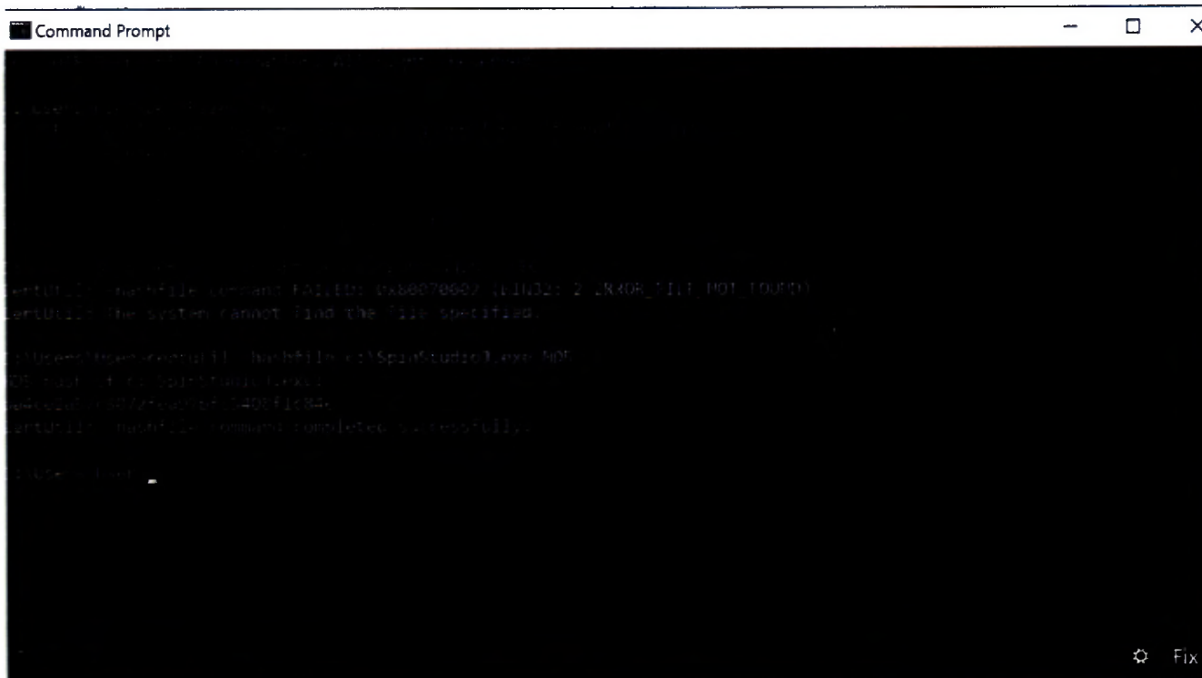
Рисунок 2. Окно с цифровым идентификатором ПО SpinStudioJ.

7.3.3. ЯМР-спектрометр Quantum считается выдержавшим поверку по п. 7.3, если версия ПО SpinStudioJ не ниже 1.2.9, а текущая версия и цифровой идентификатор ПО SpinStudioJ совпадают с указанными в технической документации на поверяемый прибор, предоставленной авторизованным фирмой-производителем инженером.