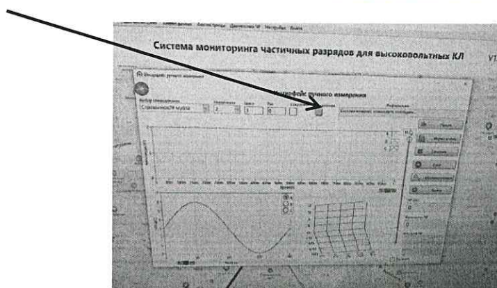
б) проверка загорания зеленой кнопки в ПО