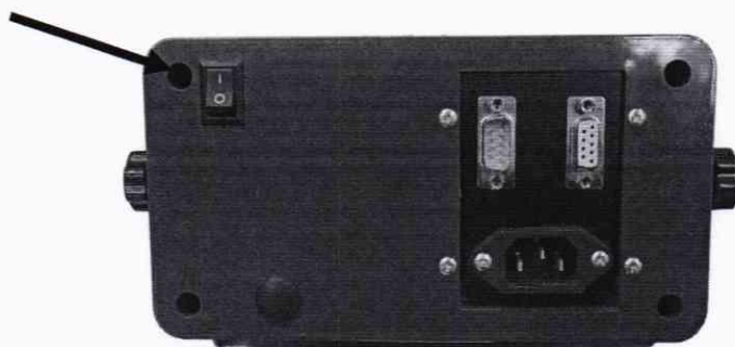
Рисунок 1 – Схема пломбировки от несанкционированного доступа и обозначение места для нанесения оттиска клейма

Знак поверки в виде клейма наносится на пломбу, предотвращающую несанкционированное вмешательство (рисунок 1).