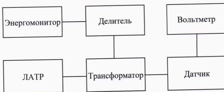
Рисунок 3 – Структурная схема определения основной относительной погрешности коэффициента масштабного преобразования

3) При помощи ЛАТРа и трансформатора поочередно воспроизвести испытательные сигналы напряжения переменного тока согласно таблице 4.