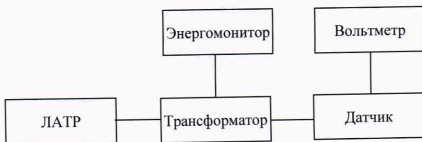
Рисунок 2 – Структурная схема определения основной относительной погрешности коэффициента масштабного преобразования

2) Собрать схему, представленную на рисунке 2 (для испытательного сигнала напряжения переменного тока 500 В) или 3 (для испытательных сигналов напряжения переменного тока 3500, 6500, 9500 и 13000 В).