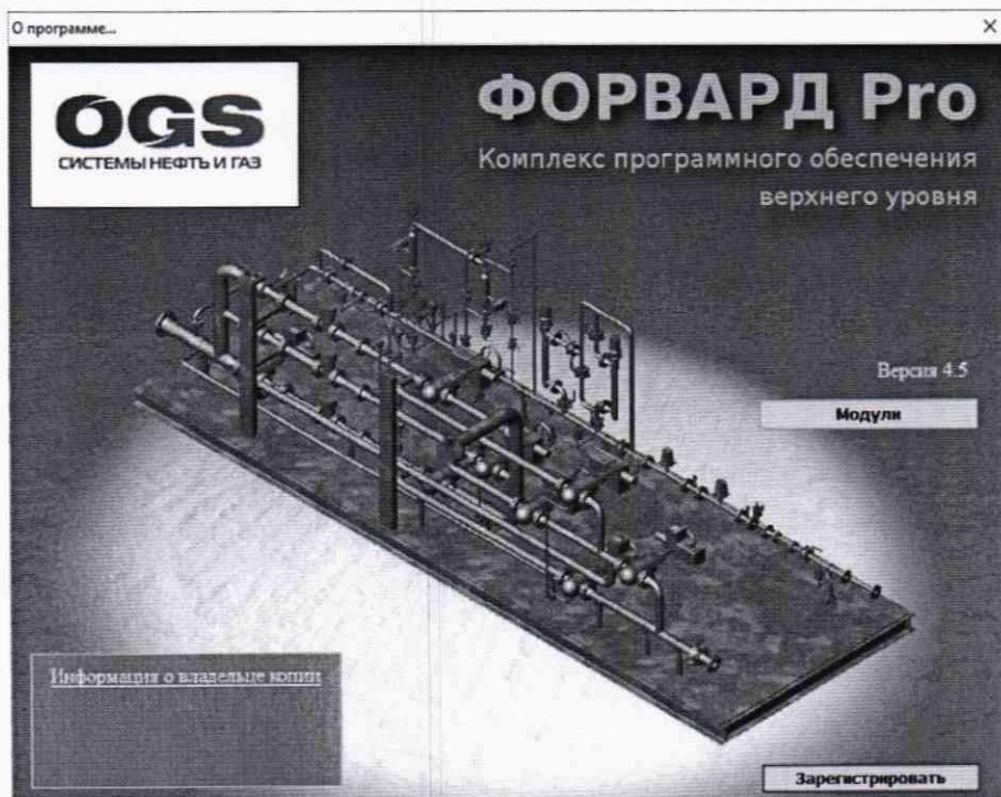
Рисунок 1. Окно «О программе».