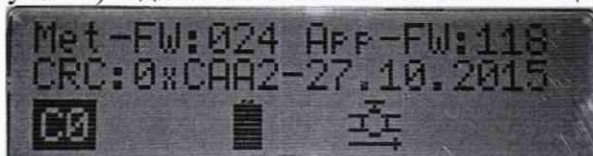
Рисунок 1- Отображение идентификационных данных ПО на ЖК дисплее

Идентификация ПО преобразователя осуществляется по номеру версии и контрольной сумме, вычисленной по алгоритму CRC. Идентификационные данные отображаются на ЖК дисплее в меню «C0» (рисунок 1) и должны соответствовать таблице 3