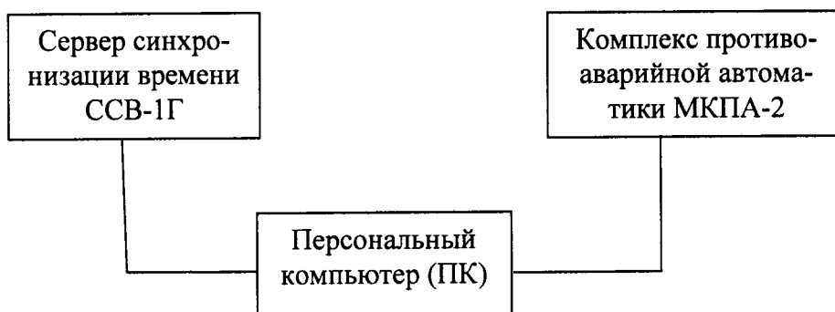
Рисунок 3 - Схема определения абсолютной погрешности измерений интервала времени