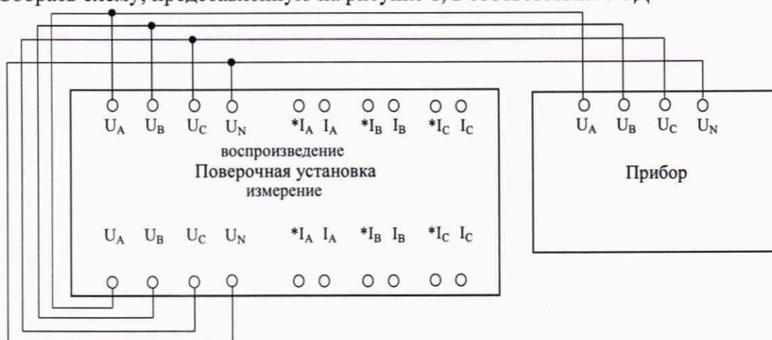
Рисунок 1 – Схема подключения при измерении напряжения переменного тока

2) Подготовить к работе и включить поверочную установку, поверяемый прибор, а также вспомогательные средства измерений и оборудование согласно их ЭД.