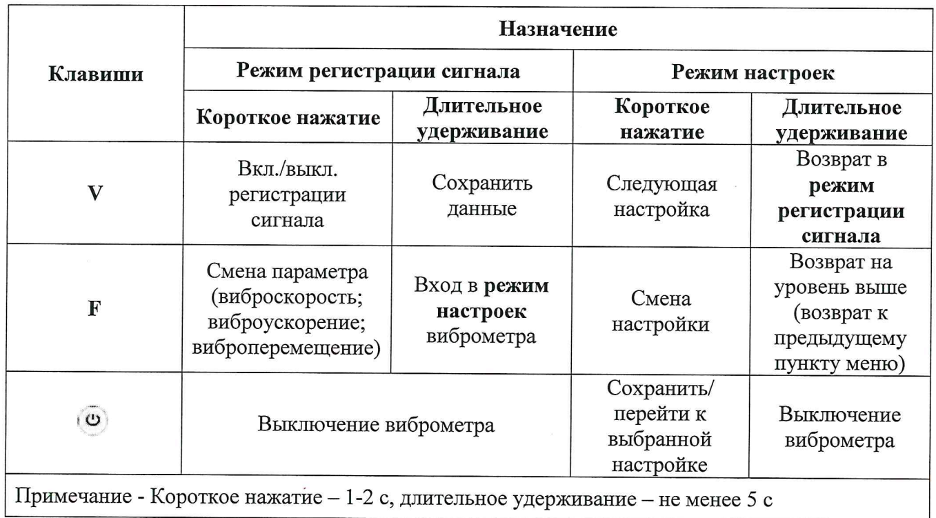
Таблица 3 – Назначение клавиш

6.5 Назначение клавиш виброметра указано в таблице 3.