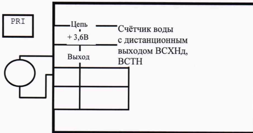
Схема проверки импульсов дистанционного выходного сигнала счётчиков воды ВСХНд, ВСТН.