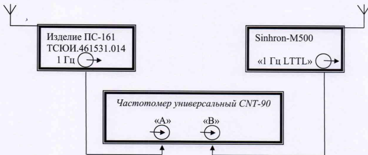
Рисунок 2 – Схема для определения абсолютной разности формируемой ШВ относительно национальной шкалы координированного времени UTC(SU) в режиме синхронизации по сигналам ГНСС ГЛОНАСС/GPS

8.5.1 Абсолютная разность формируемой ШВ относительно национальной шкалы координированного времени UTC(SU) в режиме синхронизации по сигналам ГНСС ГЛОНАСС/GPS определить с помощью изделия ПС-161 ТСЮИ.461531.014, работающего в режиме синхронизации по сигналам ГНСС ГЛОНАСС/GPS, и частотомера универсального CNT-90 по схеме, приведенной на рисунке 2.