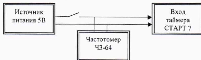
Рисунок 1 – Схема подключения

Отключить преобразователь весоизмерительный ТВ-003/05Д от входа «Таймер», собрать схему в соответствии с рисунком 1.