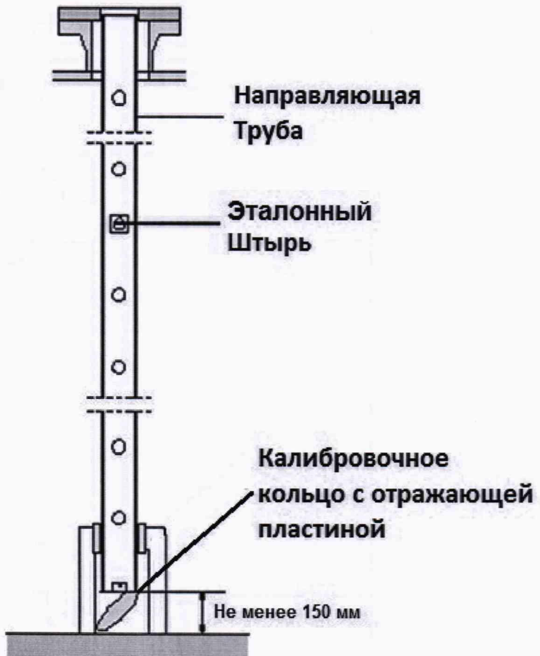
Рисунок А.1 – Схема установки уровнемера при поверке в резервуарах с сжиженным газом, находящимся под атмосферным давлением и в резервуарах с сжиженным газом, не подлежащим разгерметизации