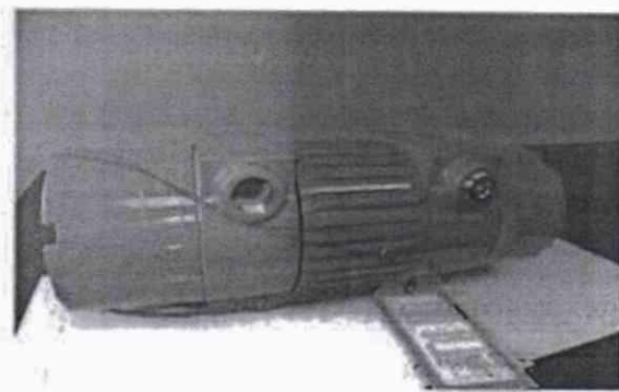
Рисунок В.2 – Места пломбировки блоков первичных акустических преобразователей на корпусе УЗР (КР УЗР) и трансмиттера УЗР (КР УЗР).