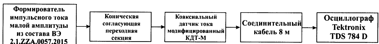
Рисунок 2 – Схема определения метрологических характеристик шунта коаксиального датчика тока модифицированного КДТ-М

8.2.6 Опробование коаксиального датчика тока модифицированного КДТ-М проводят в соответствии со схемой, приведенной на рисунке 2.