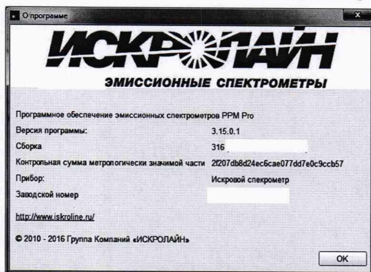
Рисунок 2. Окно с номером версии ПО PPM Pro и цифровым идентификатором метрологически значимого файла

7.3.2. Спектрометр эмиссионный ИСКРОЛАЙН считается выдержавшим поверку по п. 7.3, если версия ПО PPM Pro не ниже 3.15.0.1, а полная версия и цифровой идентификатор ПО PPM Pro совпадают с указанными в Паспорте на поверяемый прибор.