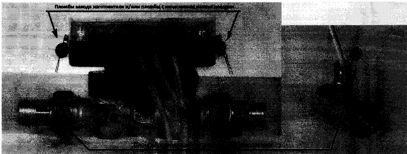
Рисунок 2 – Схема пломбировки теплосчетчика

ВНИМАНИЕ! В случае нарушения или несанкционированного снятия пломб предприятия-изготовителя потребителями, теплосчетчик к эксплуатации не допускается, а предприятие-изготовитель снимает с себя гарантийные обязательства.