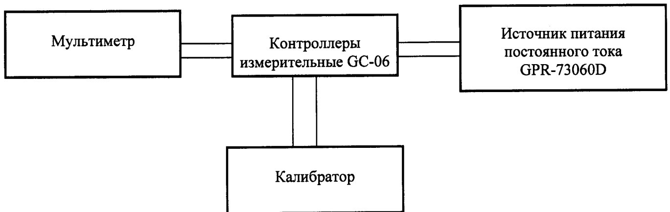
Рисунок 1 - Структурная схема определения погрешности измерений (преобразований)

1) подготовить к работе калибратор универсальный 9100 (далее - калибратор), мультиметр 3458А (далее - мультиметр) и источники питания постоянного тока GPR-73060D (далее – источник питания) в соответствии с их эксплуатационной документацией, собрать схему, представленную на рисунке 1;