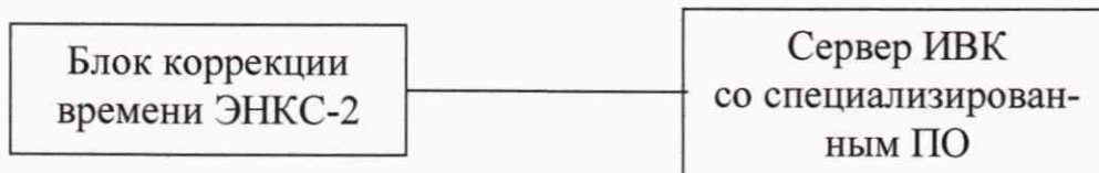
Рисунок 1 - Схема проверки ухода часов на сервере ИВК

Включают блок коррекции времени ЭНКС-2, принимающий сигналы глобальной навигационной спутниковой системы (ГЛОНАСС), подключают к ноутбуку, где настраивают специализированное ПО для применяемого эталонного устройства синхронизации времени, УСПД подключают к ноутбуку (Рисунок 2). В течение суток сверяют показания блока коррекции времени ЭНКС-2 с показаниями часов УСПД, получающего сигналы точного времени от встроенного приемника точного времени. Расхождение показаний блока коррекции времени с УСПД не должно превышать \pm 1 с. Для снятия синхронизированных измерений рекомендуется при возможности ПО зафиксировать показания обоих часов или сделать скриншот экрана, на котором выведены эталонные и проверяемые часы.