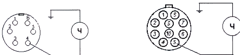
Рисунок 1 - Разъемы подключения преобразователей

6.3.3 Зафиксировать максимальное отклонение от устанавливаемого в дефектоскопе значения показаний частотомера на частотах 100, 1000, 100 000, 500 000, 1 000 000, 5 000 000 и 10 000 000 Гц.