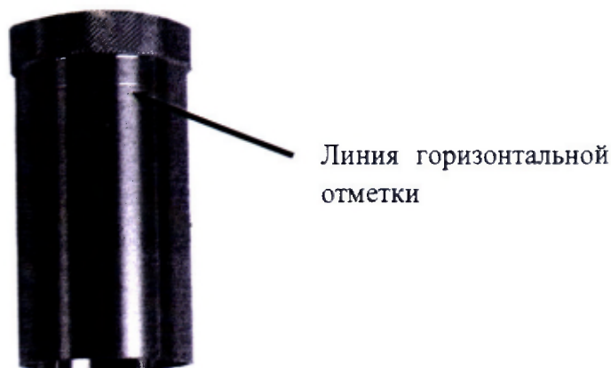
Рисунок 1 - Уровень погружения ротора

Поместить необходимое количество СО по п. 4.1 в стакан таким образом, чтобы уровень жидкости совпадал с линией горизонтальной отметки на роторе (рисунок 1), и запустить измерения динамической вязкости стандартного образца согласно РЭ вискозиметров.