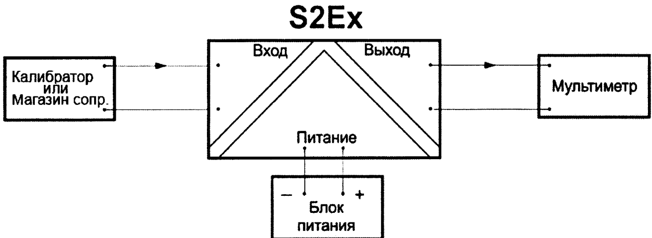
Рис. 2 – Схема подключения барьеров типа S2Ex