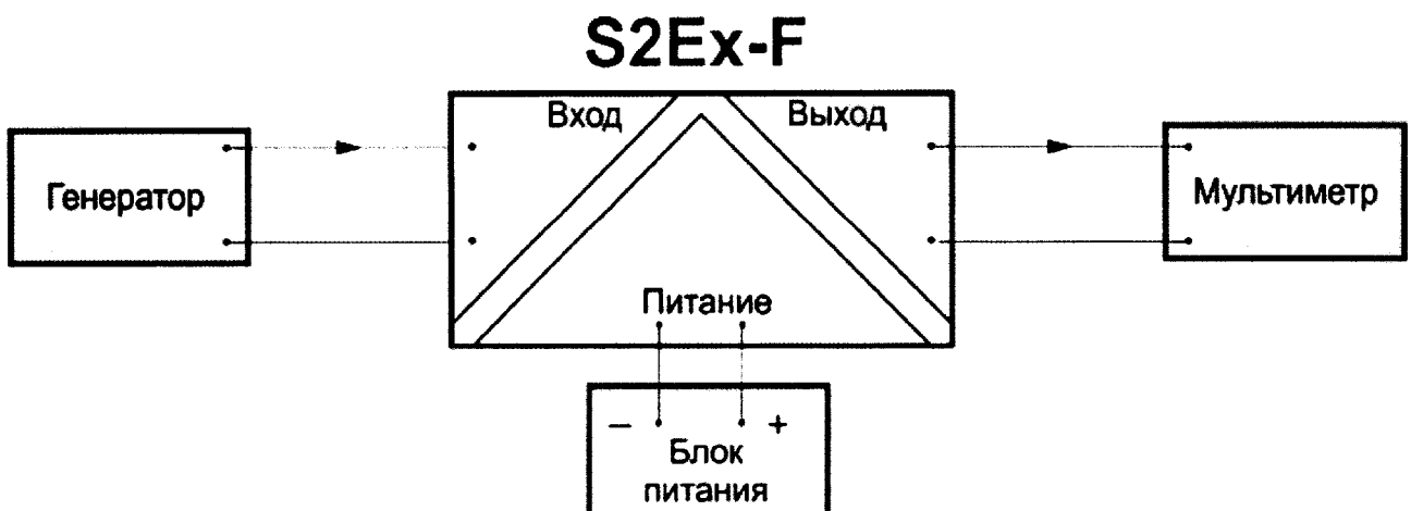
Рис. 4 – Схема подключения барьеров типа S2Ex-F