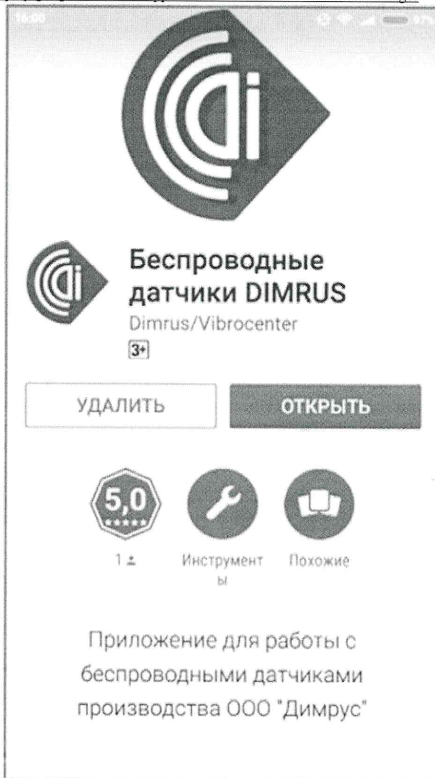
Рисунок 1 – ПО «Беспроводные датчики DIMRUS».

https://play.google.com/store/apps/details?id=com.dimrus.sensormanager