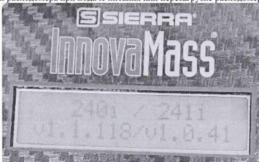
Рисунок 1. Отображение версии ПО

6.3.1. Идентификация ПО осуществляется проверкой его идентификационных данных. Идентификация осуществляется по номеру версии. Номер версии встроенного ПО выводится на дисплей расходомера при подаче питания или перезагрузке расходомера.