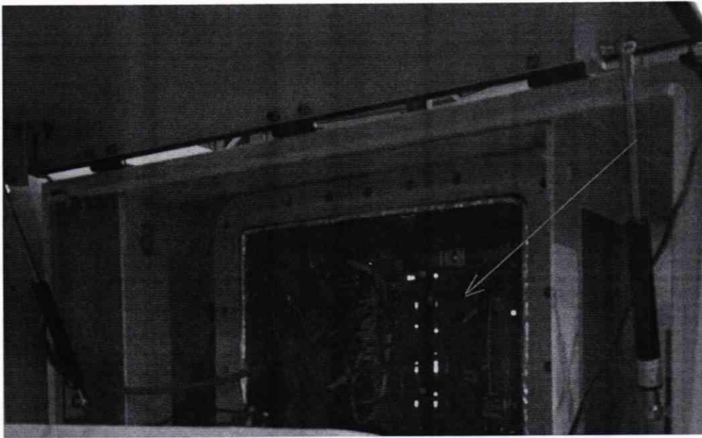
Рисунок 2 – Место нанесения знака поверки (боковая панель колонки, крышка снята)