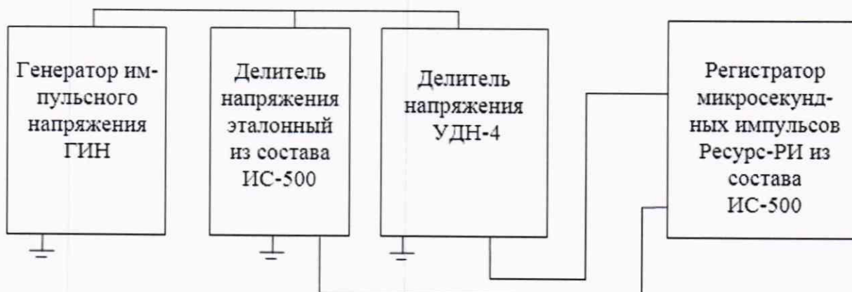
Рисунок 4 – Схема определения относительной погрешности преобразований напряжения стандартизованных коммутационных и грозовых импульсов

9.3.1.4 Подайте с ГИН напряжение стандартизованного коммутационного импульса 70 кВ положительной полярности и произведите измерения. Результаты занесите в таблицу 9.