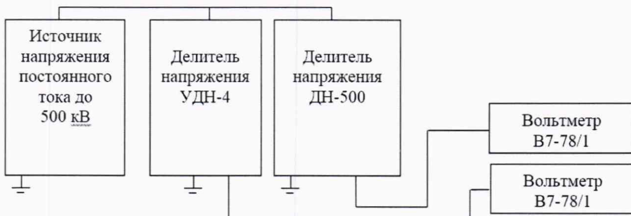
Рисунок 3 – Схема проверки погрешности преобразований напряжения постоянного тока

9.2.1.1 Соберите схему, приведенную на рисунке 3, на поверяемом делителе включите значение коэффициента масштабного преобразования ( K_U ) равным 2000.