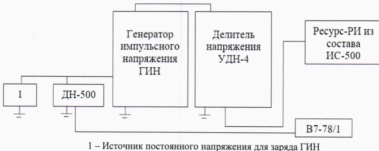
Рисунок 5 – Схема проверки линейности коэффициентов масштабного преобразования при работе на напряжении стандартизованных коммутационных и грозовых импульсов

9.3.2.4 Подайте с ГИН напряжение стандартизованного коммутационного импульса 500 кВ положительной полярности и произведите измерения. Результаты занесите в таблицу 10.