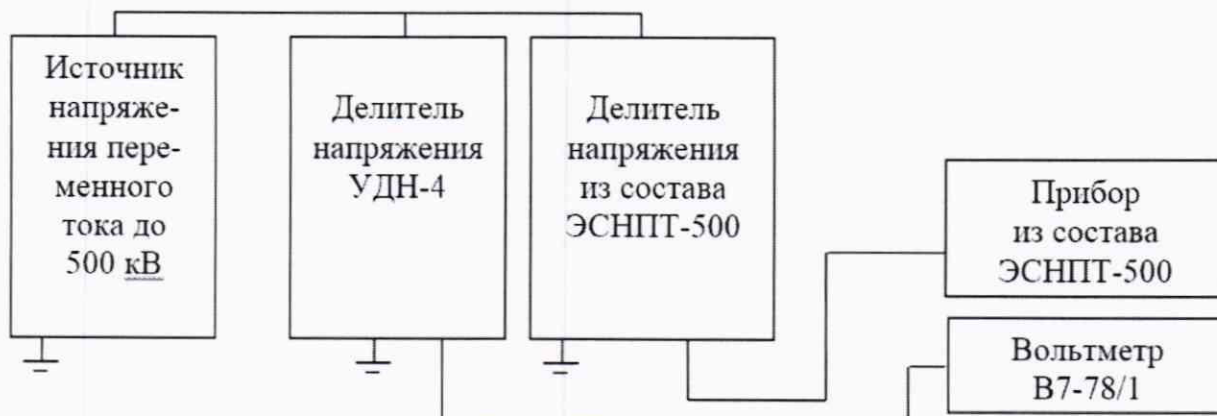
Рисунок 2 – Схема проверки погрешности преобразований напряжения переменного тока

9.1.1.1 Соберите схему, приведенную на рисунке 2, на поверяемом делителе включите значение коэффициента масштабного преобразования ( K_U ) равным 2000.