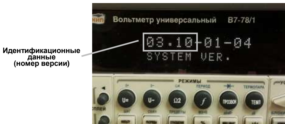
Рисунок 1. Номер версии ПО вольтметра В7-78/1.