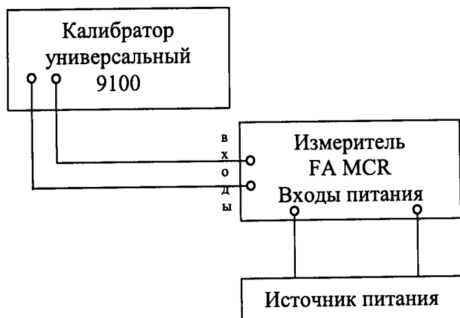
Рисунок 1 – Структурная схема проверки допускаемой приведенной (приведенной к максимальному значению диапазонов выходных сигналов) погрешности измерения

3) Воспроизвести с калибратора универсального 9100 (далее по тексту – калибратор) последовательно 5 испытательных сигналов силы постоянного тока, равномерно распределенных внутри диапазона измерения.