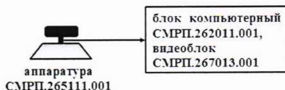
Рисунок 1 - Схема для проведения измерений при проверке работоспособности и определения погрешности определения координат местоположения

8.2.1 Собрать схему в соответствии с рисунком 1.