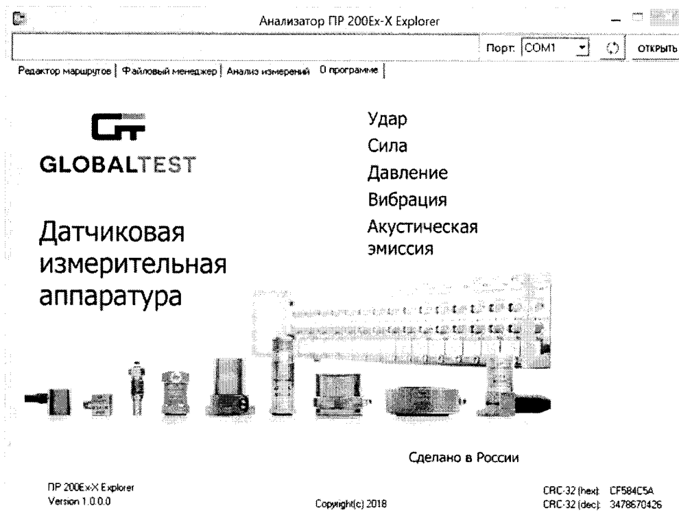
Рисунок 1 – Пример окна с информацией о ПО

7.2.1 Проверку ПО проводят в соответствии с 4.1.7 АБКЖ.00028-01 34 «ПР 200Ex-X Explorer. Руководство оператора». Цифровой идентификатор ПО рассчитывается автоматически при каждом запуске ПО «ПР 200Ex-X Explorer». Для вызова окна с информацией о версии ПО и результатов расчета цифрового идентификатора необходимо в меню выбрать пункт «О программе». Пример всплывающего окна приведен на рисунке 1.