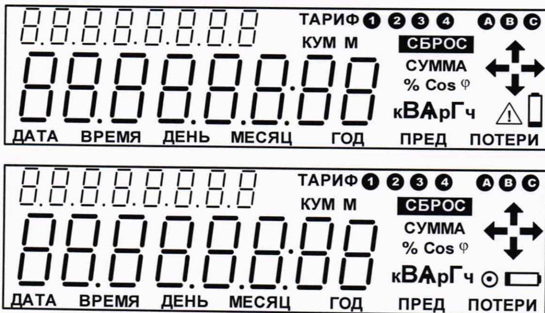
Рисунок 1 – Внешний вид ЖКИ

6.3.4 Внешний вид ЖКИ счетчиков «Меркурий 204», «Mercury 204», «Меркурий 234», «Mercury 234» должен соответствовать рисунку 1 (в счетчике может использоваться ЖКИ одного из двух типов). Для англоязычной торговой марки «Mercury» надписи на ЖКИ могут отображаться на английском языке.